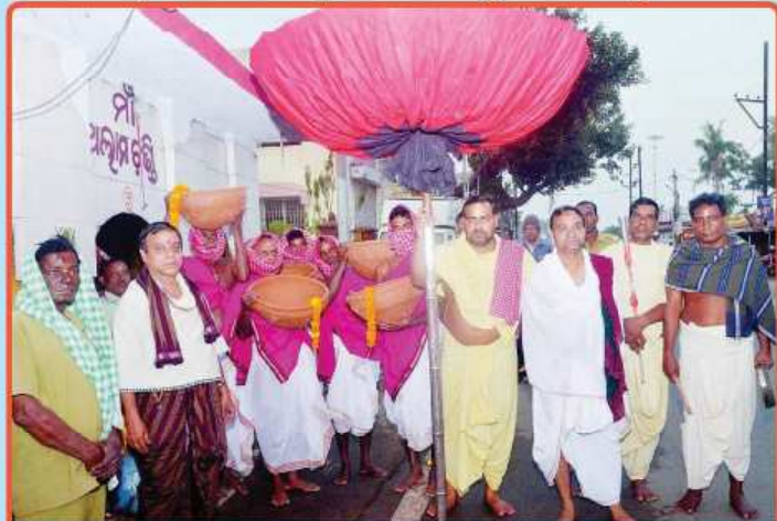
ତା. ୧୪.୧.୨୦ରେ ଶ୍ରୀମନ୍ଦିରରେ ମକର ଋତୁକ ପ୍ରସ୍ତୁତି ନିମନ୍ତେ ମା'ଆଳାମନ୍ତ୍ରଣୀଙ୍କ ମନ୍ଦିରକୁ କୁମ୍ଭାର ସେବକମାନେ 'ମକର ତାଡ଼' ନେଇ ଶ୍ରୀମନ୍ଦିରକୁ ଯାଉଛନ୍ତି ।

ଶ୍ରୀମନ୍ଦିର ନାଟମନ୍ଦିରରେ ସ୍ଵାପିତ 'ହୁଣ୍ଡି'ରେ ମୁକ୍ତ ହସ୍ତରେ ଦାନ କରନ୍ତୁ । ଶ୍ରୀମନ୍ଦିର ପ୍ରଶାସନ, ପୁରୀ