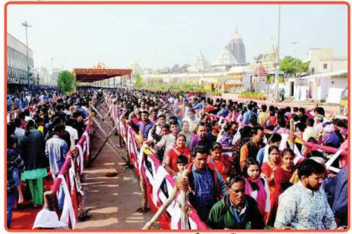
ଏହାପରେ ମହାପ୍ରଭୁଙ୍କ ନିରନ୍ତର ଦର୍ଶନ ପାଇଁ ଭକ୍ତଙ୍କୁ ଛଡ଼ା ଯାଇଥିଲା ।

ନୂଆ ବର୍ଷର ପୂର୍ବରାତ୍ର ଅର୍ଥାତ୍ ତା.୩୧.୧୨.୧୯ରିଖ ଘ.୯.୩୦.ମି.ରେ ପହୁଡ଼ ନୀତି କରାଯାଇ ରାତ୍ର ଘ.୧.୨୦ମି.ରେ ଶ୍ରୀମନ୍ଦିରର ଦ୍ୱାର ଫିଟାଯାଇଥିଲା ଏହାପରେ ଘ.୧.୫୫ମି.ରେ ମଙ୍ଗଳ ଆଳତି, ରାତ୍ର ଘ.୨.୫୦ମି.ରେ ଅବକାଶ, ଭୋର ଘ.୫.୪୦ମି.ରେ ପହିଲି ଭୋଗ ନୀତି ଶେଷ ହୋଇଥିଲା । ସକାଳ ଧୂପ ଘ.୭.୦୫ମି.ରେ ଶେଷ ହୋଇଥିଲା । ମହାପ୍ରଭୁଙ୍କ ମଧ୍ୟାହ୍ନ ଧୂପ ଘ.୧୧ରେ ବଢ଼ିବା ପରେ ଦ୍ୱିତୀୟ ଭୋଗ ମଣ୍ଡପ ନୀତି ଅପରାହ୍ଣ ଘ. ୧.୫୦ମି.ରେ ସଂପନ୍ନ ହୋଇଥିଲା ।