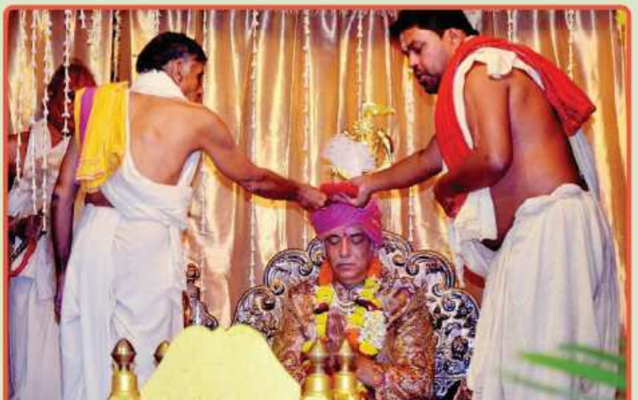
ତା. ୧୨.୧.୨୦୨୦ରେ ଶ୍ରୀନଅର ଠାରେ ଗଜପତି ମହାରାଜା ଶ୍ରୀ ଦିବ୍ୟସିଂହ ଦେବଙ୍କ ପୁଷ୍ୟାଭିଷେକ ।