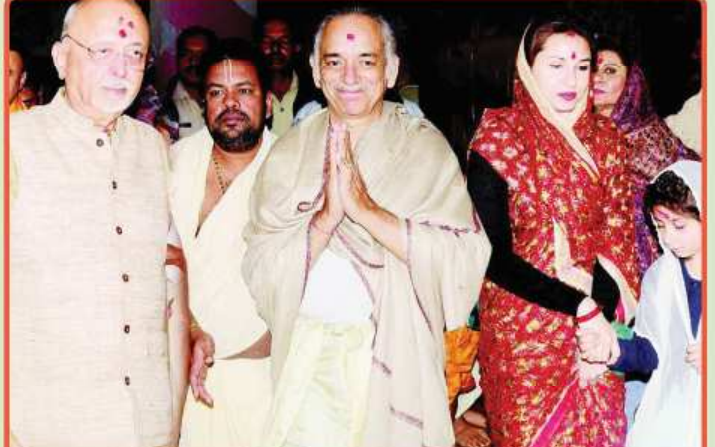
ତା. ୨୯.୧୨.୧୯ରେ ଗଜପତି ମହାରାଜା ଶ୍ରୀ ଦିବ୍ୟସିଂହ ଦେବ ଏବଂ ତାଙ୍କ ସମ୍ପର୍କୀୟମାନଙ୍କ ସହ ଶ୍ରୀମନ୍ଦିରରୁ ଶ୍ରୀବିଗ୍ରହମାନଙ୍କ ଦର୍ଶନ ସାରି ଫେରୁଛନ୍ତି ।