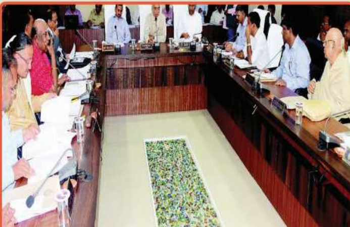
ତା. ୨୦.୧୨.୧୯ରେ ଶ୍ରୀମନ୍ଦିର ମୁଖ୍ୟ କାର୍ଯ୍ୟାଳୟ ଠାରେ ଗଜପତି ମହାରାଜା ଶ୍ରୀ ଦିବ୍ୟସିଂହ ଦେବଙ୍କ ଅଧିକ୍ଷତାରେ ଆହୂତ 'ଶ୍ରୀମନ୍ଦିର ପରିଚ୍ଛଳନା କମିଟି' ବୈଠକ ।