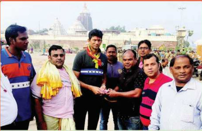
ତା. ୨୧.୧୨.୧୯ରେ ଭାରତୀୟ କ୍ରିକେଟ ଦଳର ପୂର୍ବତନ ଖେଳାଳୀ ଶ୍ରୀ ଭେଙ୍କେଟଶ ପ୍ରସାଦ ଶ୍ରୀମନ୍ଦିରର ଓ.ଏସ୍.ଡି. ଶ୍ରୀ ଶୁଭ୍ରାଂଶୁ ଶେଖର ପାଢ଼ୀଙ୍କ ଗହଣରେ ଶ୍ରୀମନ୍ଦିରରୁ ଶ୍ରୀବିଗ୍ରହମାନଙ୍କ ଦର୍ଶନ ସାରି ଫେରୁଛନ୍ତି ।