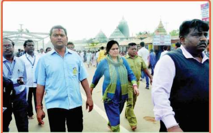
ତା. ୨୩.୧୨.୧୯ରେ ଭାରତୀୟ ପ୍ରତ୍ନତତ୍ତ୍ୱ ବିଭାଗ (A.S.I.)ର ମହାନିର୍ଦ୍ଦେଶକ ଉଷା ଶର୍ମାଙ୍କ ଶ୍ରୀମନ୍ଦିର ପରିଦର୍ଶନ ।