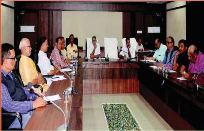
ତା. ୧୩.୧୨.୧୯ରେ ଶ୍ରୀମନ୍ଦିର ମୁଖ୍ୟ କାର୍ଯ୍ୟାଳୟ ଠାରେ ଶ୍ରୀମନ୍ଦିରର ଉପ-ମୁଖ୍ୟ ପ୍ରଶାସକ ତଥା ଜିଲ୍ଲାପାଳ ଶ୍ରୀଯୁକ୍ତ ବଳଦେବ ସିଂହଙ୍କ ଅଧିକ୍ଷତାରେ ଆହୂତ 'ନୀତି ସବ୍ କମିଟି' ବୈଠକ ।