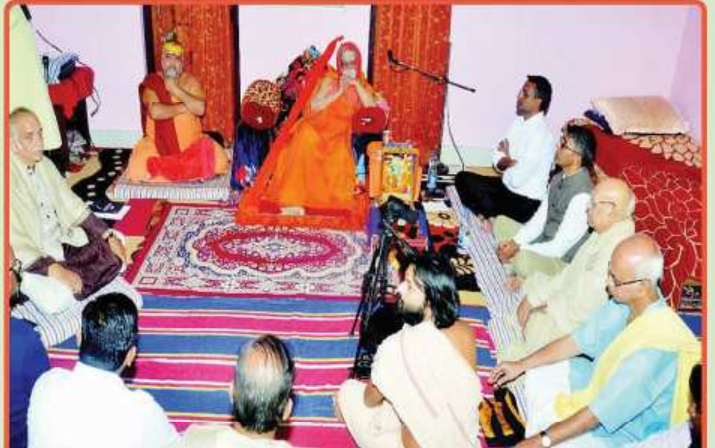
ତା. ୬.୧.୨୦୨୦ରେ ଶ୍ରୀଗୋବର୍ଦ୍ଧନ ପୀଠ ଠାରେ ଶ୍ରୀମଦ୍ ଜଗଦ୍‌ଗୁରୁ ସ୍ଵାମୀ ନିଃଲାନନ୍ଦ ସରସ୍ଵତୀଙ୍କୁ ଶ୍ରୀମନ୍ଦିର ପରିଚ୍ଛଳନା କମିଟି ସଦସ୍ୟମାନେ ଭେଟି ଉପଦେଶ ଗ୍ରହଣ କରୁଛନ୍ତି